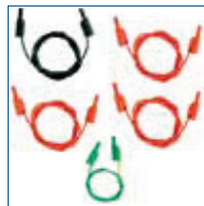
Meetsnoeren 3x rood, 1x zwart,