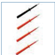
Meetpennen 3x rood, 1x zwart