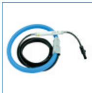
4x flexibele stroomt 30 A / 300 A / 3000 A